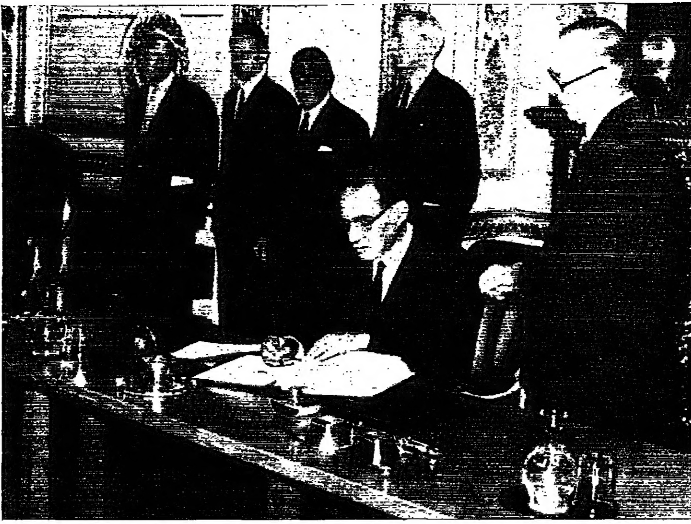
السيد احمد حسن الفقي سفير الجمهورية العربية المتحدة في لندن يوقع معاهدة منع انتشار الاسلحة النووية في «لاكستور هانس» في العاصمة البريطانية... ويرى في الصورة سفير مصر في لندن السيد محمد رياض...